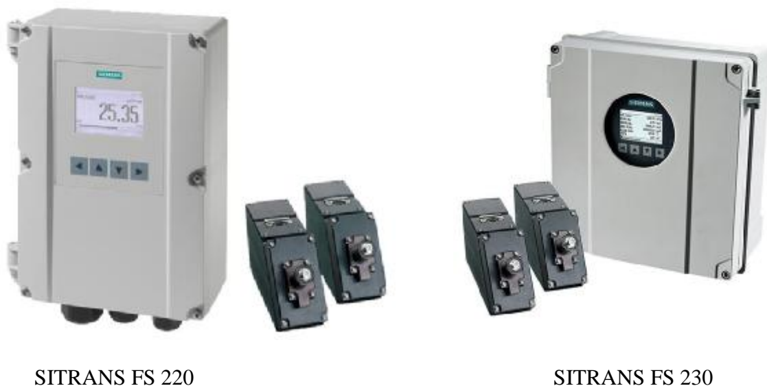
Рисунок 1 - Общий вид расходомера

Расходомеры выпускаются в двух модификациях - SITRANS FS 220 и SITRANS FS 230, отличающихся вторичным преобразователем и точностью измерений.