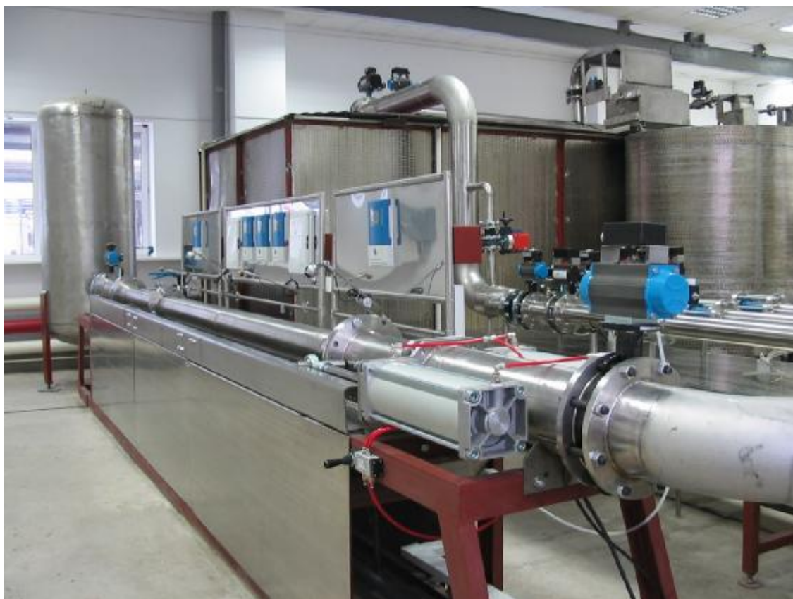
Рисунок 2 – Общий вид установок

Пломбировка установок осуществляется с помощью свинцовой (пластмассовой) пломбы и проволоки, которой пломбуются фланцевые соединения расходомеров установки, с нанесением знака поверки на пломбу. Средства измерений условий окружающей и измеряемой среды пломбуются в соответствии с описанием типа на конкретное средство измерений. Места нанесения знака поверки на фланцевые соединения расходомеров установок приведены на рисунке 3.