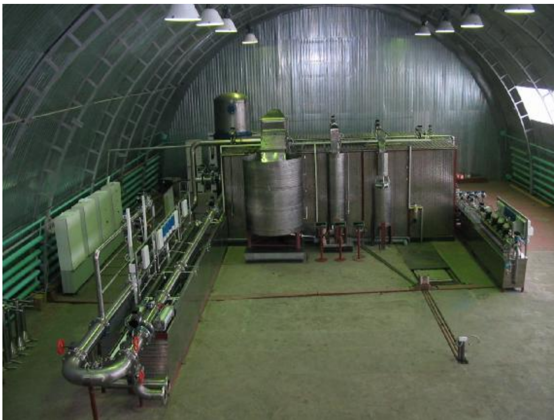
Рисунок 1 – Общий вид установок поверочных УПР

Общий вид установок поверочных УПР представлен на рисунке 1 и 2.