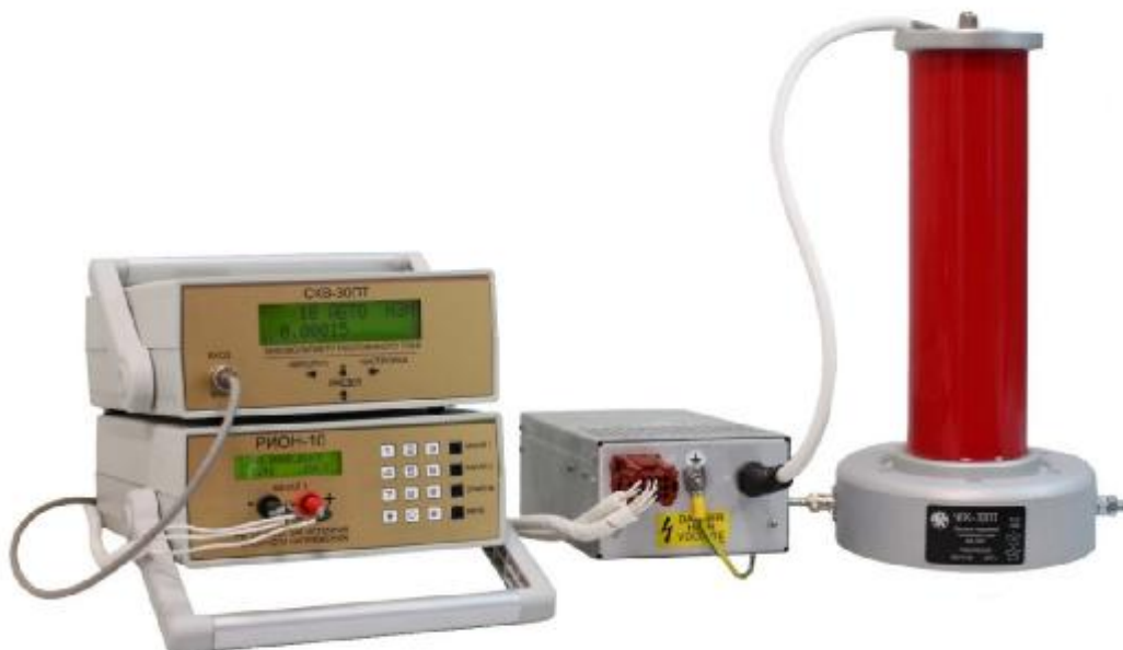
Рисунок 1 - Общий вид средства измерений

Обозначение мест пломбировки от несанкционированного доступа приведено на рисунке 2.