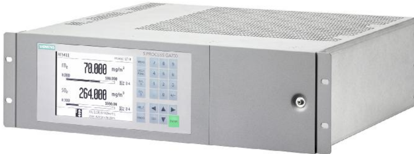
Рисунок 1 – Общий вид газоанализаторов SIPROCESS GA700 (исполнение в корпусе, предназначенном для установки в стойку 19”)

Схема пломбировки корпуса газоанализаторов от несанкционированного доступа приведена на рисунке 4.