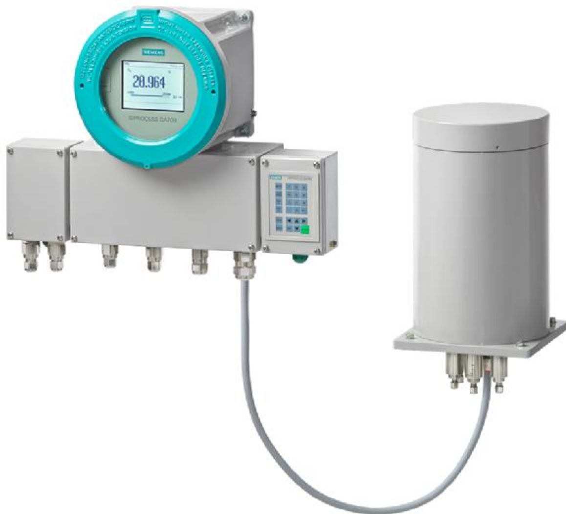
Рисунок 3 – Общий вид газоанализаторов SIPROCESS GA700 (исполнение в корпусе для полевого монтажа)