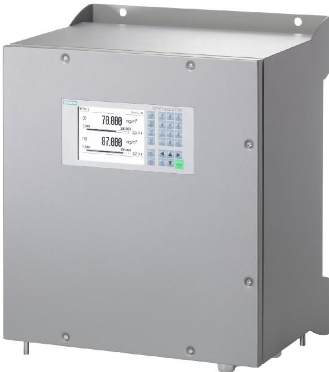
Рисунок 2 – Общий вид газоанализаторов SIPROCESS GA700 (исполнение в корпусе для настенного монтажа)