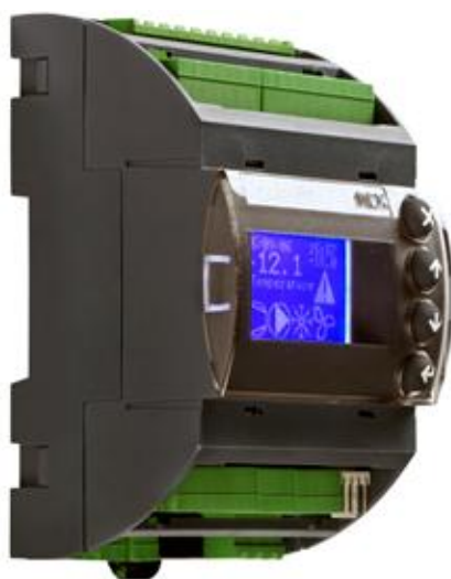
Рисунок 1.1 – МСХ06D RU

Общий вид контроллеров МСХ представлен на рисунке 1.