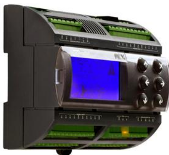
Рисунок 1.2 – МСХ08M2 RU