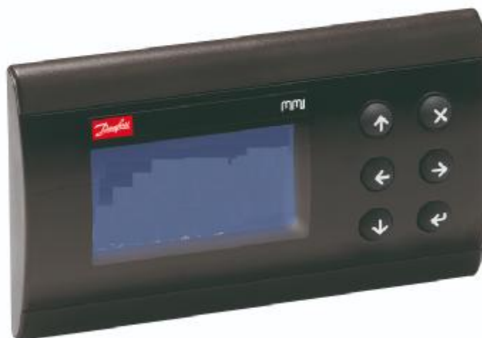
Рисунок 3 – Общий вид сервисного дисплея MMIGRS2

Пломбирование контроллеров МСХ не предусмотрено.