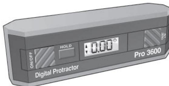
Рисунок 2 – Общий вид угломеров Pro 3600 (модель 950-318)