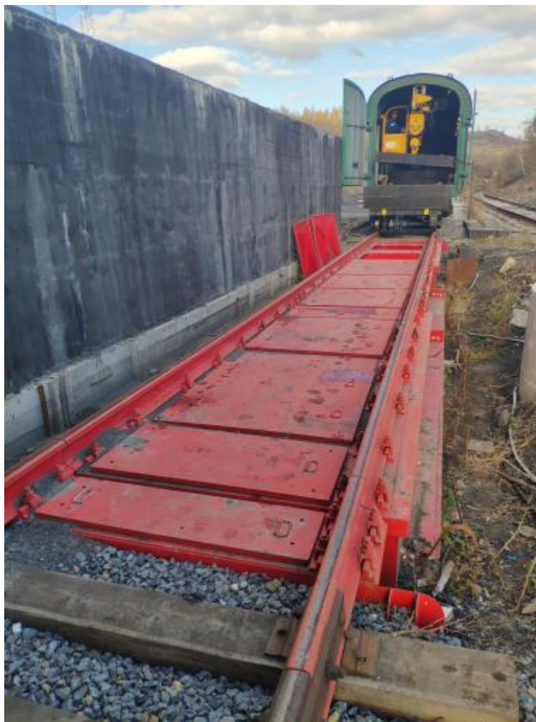
Рисунок 1 – Общий вид ГПУ весов

Общий вид ГПУ весов представлен на рисунке 1.