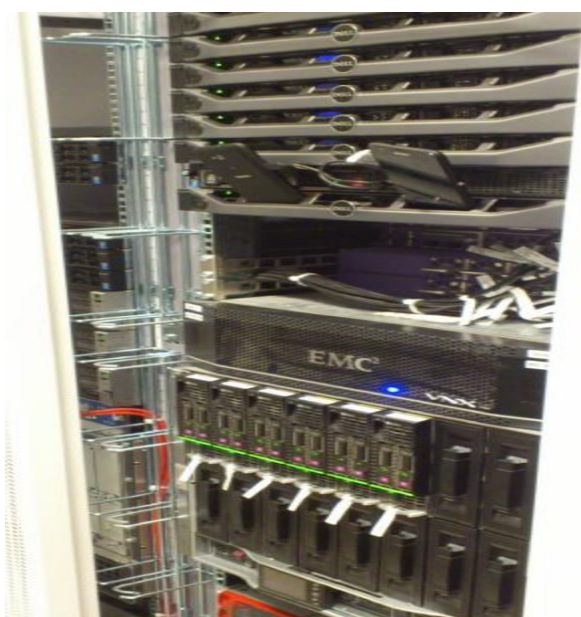
Рисунок 1 – Внешний вид шкафа

Внешний вид оборудования и место блокировки от несанкционированного доступа, представлены на рисунках 1 и 2.