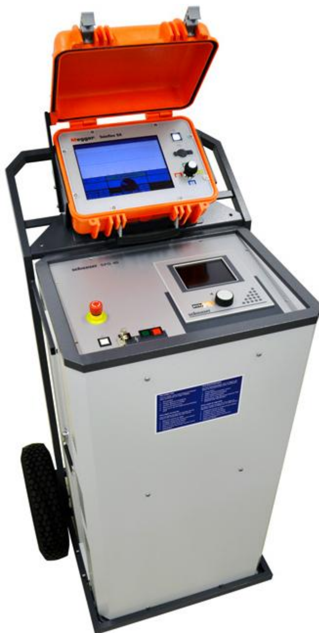
Рисунок 5 – Общий вид систем Surgeflex 40