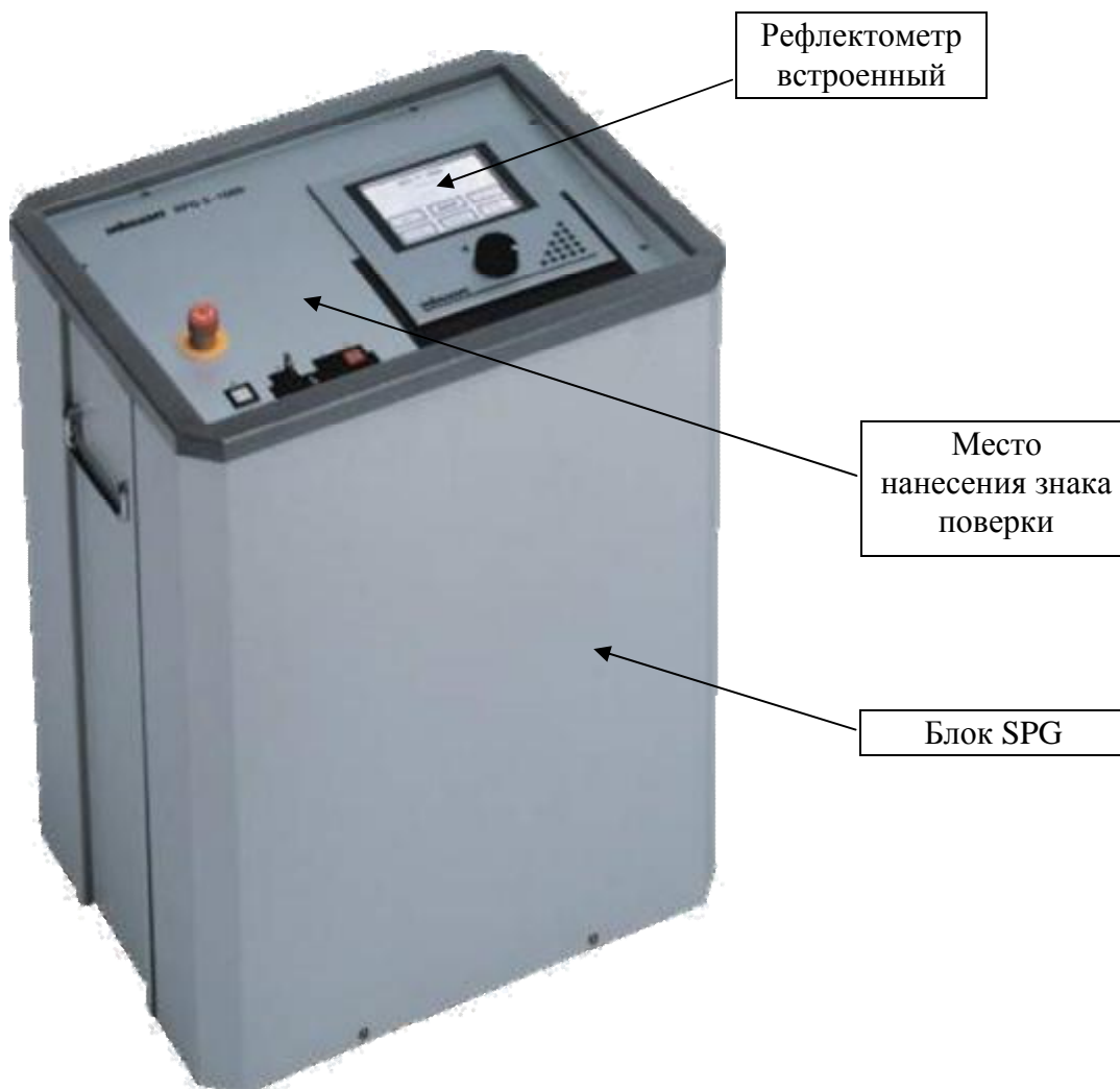
Рисунок 1 – Общий вид систем Surgeflex 5-1000

Пломбирование систем испытаний и поиска повреждения кабелей Surgeflex, Centrix не предусмотрено.