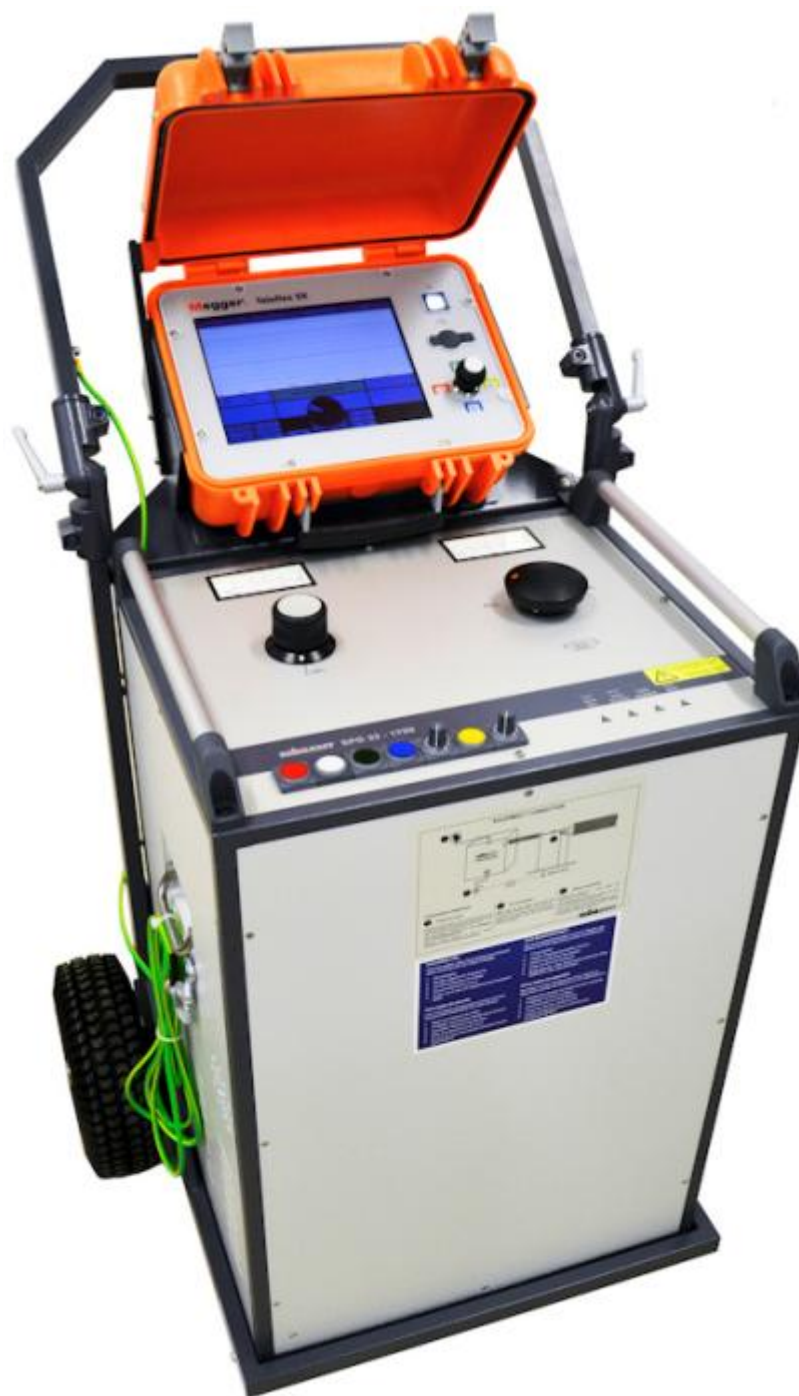
Рисунок 4 – Общий вид систем Surgeflex 32