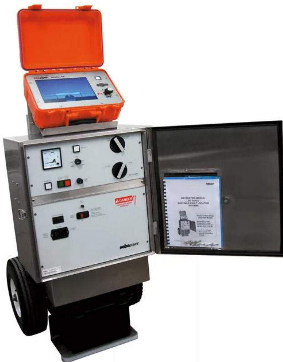
Рисунок 3 – Общий вид систем Surgeflex 12, Surgeflex 16