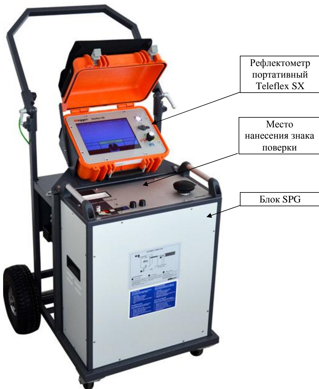
Рисунок 2 – Общий вид систем Surgeflex 8-1000