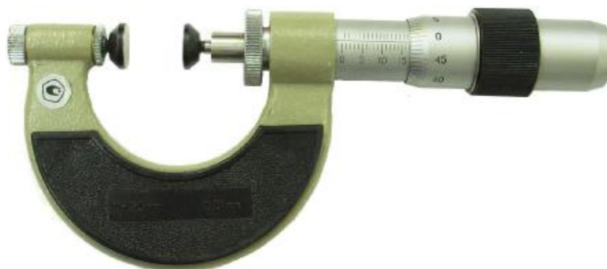
Рисунок 2 – Общий вид микрометров МВП

Число модификаций микрометра МВП – 1 (МВП 25) .