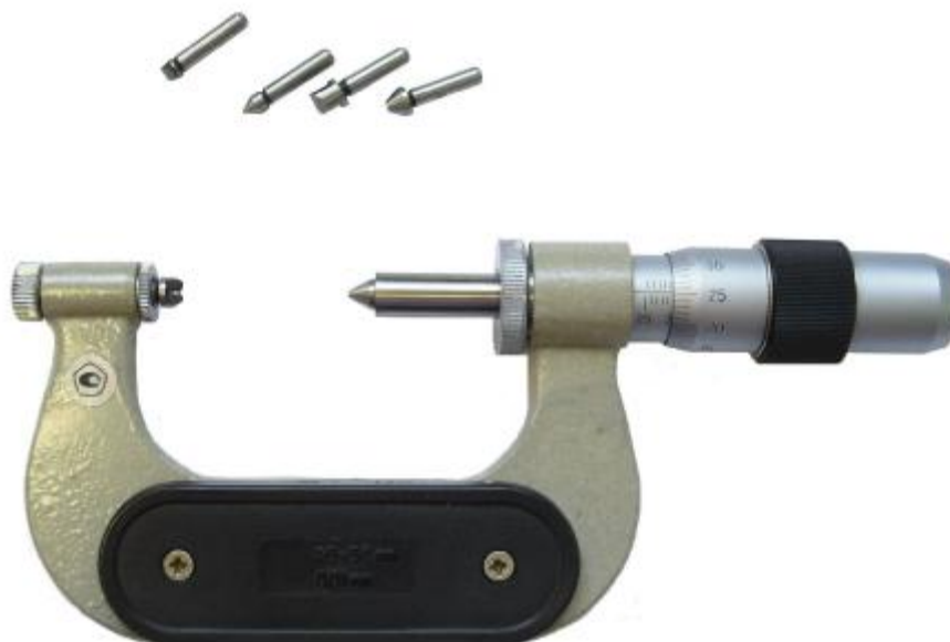
Рисунок 1 – Общий вид микрометров МВМ

Число модификаций микрометров МВМ – 14 (МВМ 25, МВМ 50, МВМ 75, МВМ 100, МВМ 125, МВМ 150, МВМ 175, МВМ 200, МВМ 225, МВМ 250, МВМ 275, МВМ 300, МВМ 325, МВМ 350), отличающихся друг от друга диапазонами измерений, нормируемой погрешностью, габаритными размерами и массой.