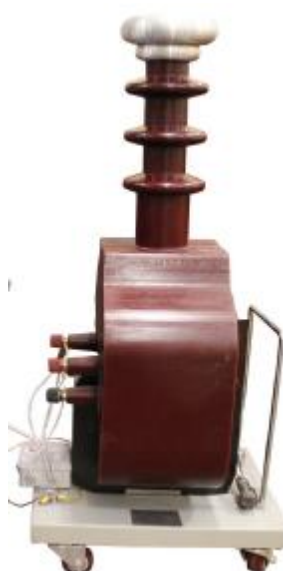
Блоки высоковольтные с литой изоляцией всех модификаций