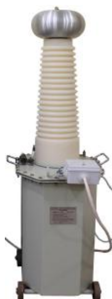
Блоки высоковольтные с масляной изоляцией на номинальные напряжения 100 и 120 кВ