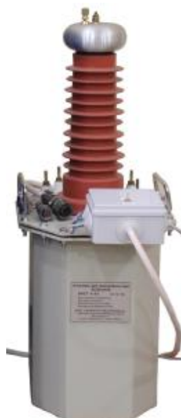
Блок высоковольтный с масляной изоляцией на номинальное напряжение 50 кВ