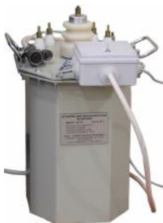
Блок высоковольтный с масляной изоляцией на номинальное напряжение 15 кВ