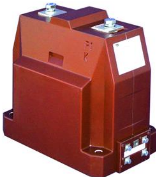
Рисунок 5 – Общий вид трансформаторов тока GS 12, GS 24