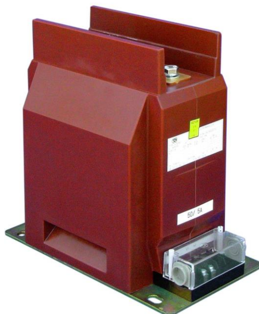
Рисунок 3 – Общий вид трансформаторов тока GIS 12, GIS 24 с изолирующим барьером