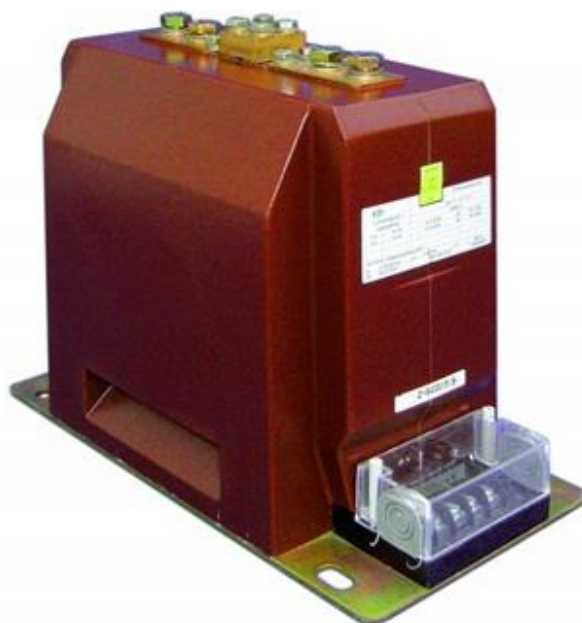
Рисунок 4 – Общий вид трансформаторов тока GIS 24