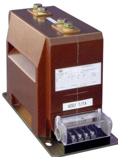
Рисунок 6 – Общий вид трансформаторов тока GSWS 12