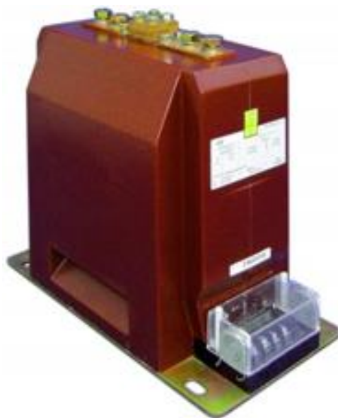
Рисунок 7 – Общий вид трансформаторов тока GSWS 24