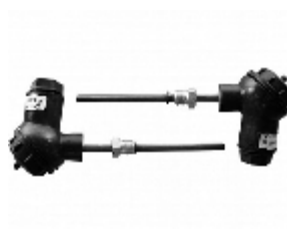
д.3) КТПТР-01, КТПТР-03, КТПТР-06, КТПТР-07, КТПТР-08, КТПТР-04, КТПТР-05, КТПТР-05/1