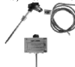
е.3) ТСП и ТСП-К