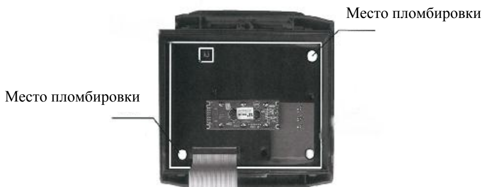
Рисунок 5 – Схема пломбировки от несанкционированного доступа вычислителей исполнений ТСВ-1х, ТСВ-2х , ТСВ-3х