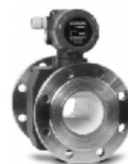
в.2) Питерфлоу РС