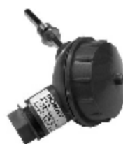
б.3) КТС-Б, ТС-Б