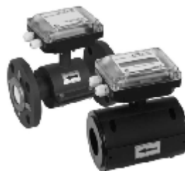
ж.2) «ВЗЛЕТ ЭР» модификации «Лайт М»