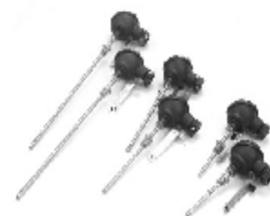
в.3) «ВЗЛЕТ ТПС»