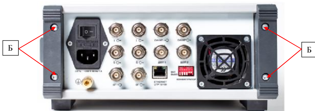
Рисунок 2 – Вид задней панели и схема пломбировки от несанкционированного доступа (Б)