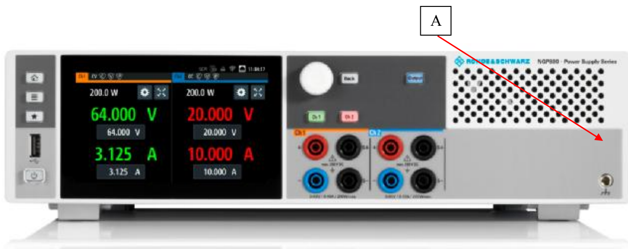
Рисунок 1 – Общий вид источников NGP802, NGP822, место нанесения знака утверждения типа (А)