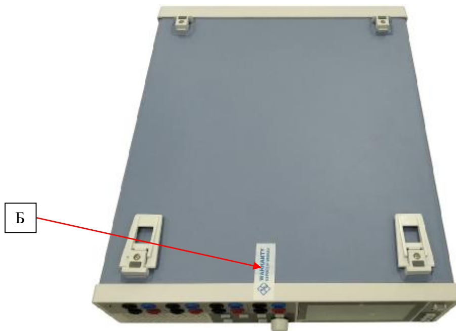
Рисунок 4 – Схема опломбирования источников (Б)