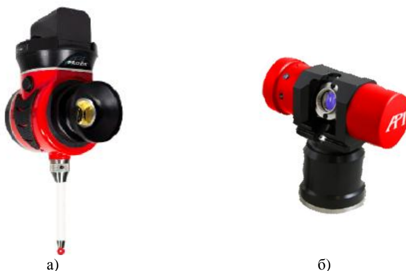
Рисунок 2 - Общий вид дополнительных устройств (а – беспроводной щуп vProbe; б – активный отражатель Active Target)