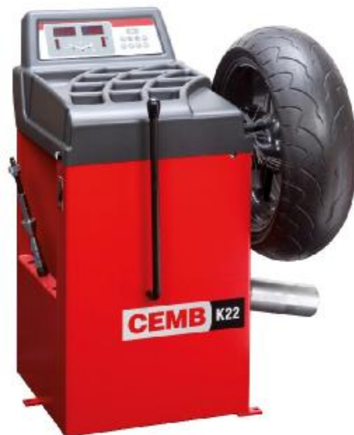
Рисунок 23 - Общий вид станков K22 bike