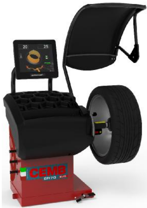
Рисунок 17 - Общий вид станков ER70SE EVO