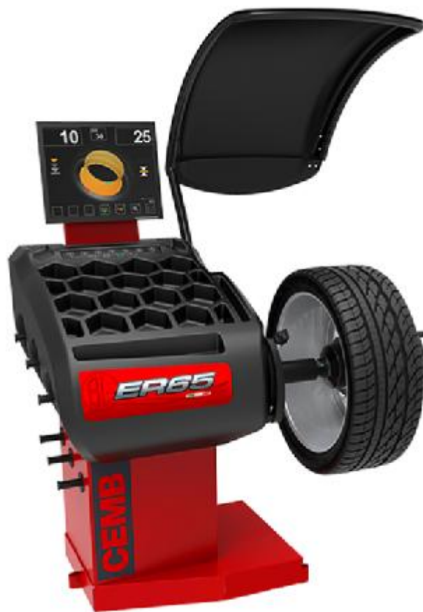
Рисунок 14 - Общий вид станков ER65