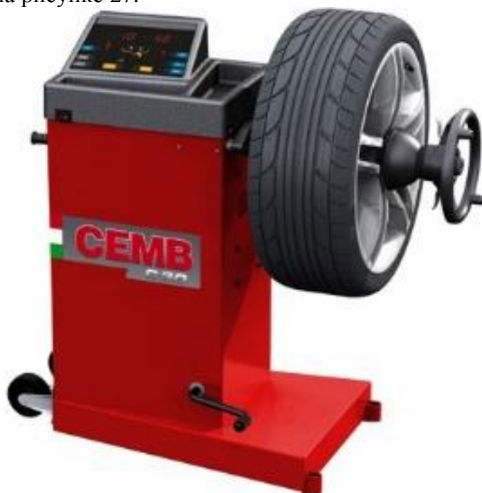
Рисунок 2 - Общий вид стендов C30