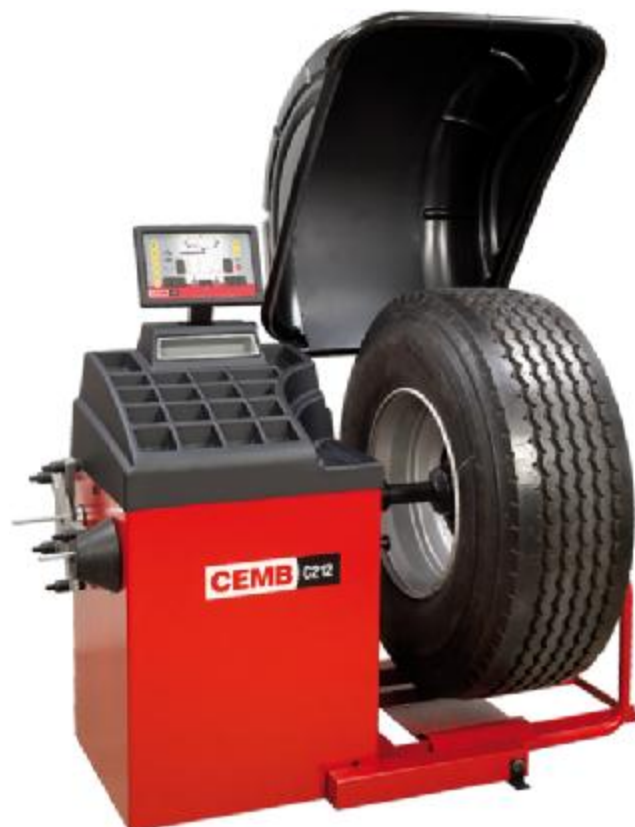
Рисунок 6 - Общий вид станков C212