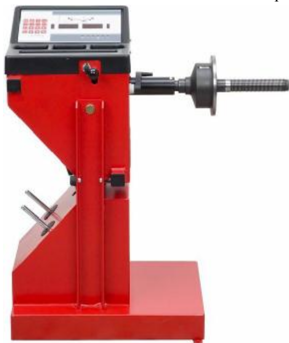
Рисунок 1 - Общий вид стендов C29 TILT

Общий вид типовой таблички приведен на рисунке 27.