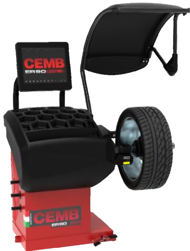
Рисунок 21 - Общий вид станков ER90 EVO