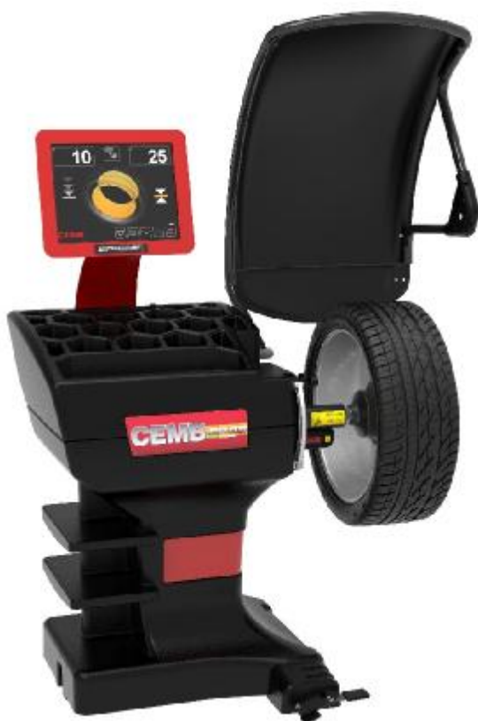
Рисунок 19 - Общий вид станков ER85 EVO, ER85 Spotter