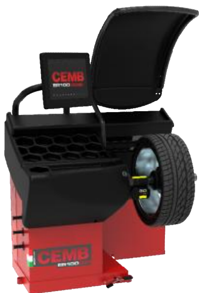
Рисунок 22 - Общий вид станков ER100 EVO