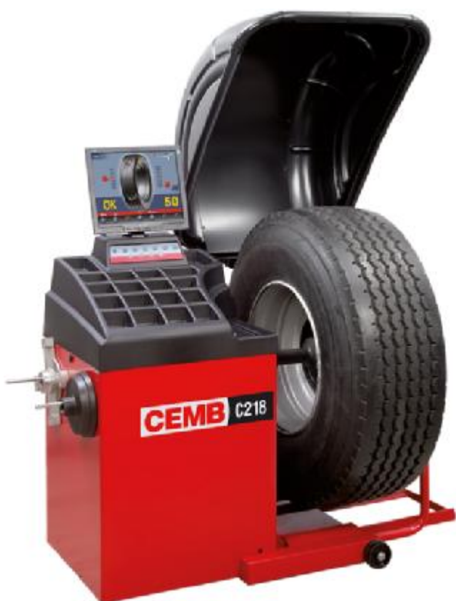
Рисунок 7 - Общий вид станков C218