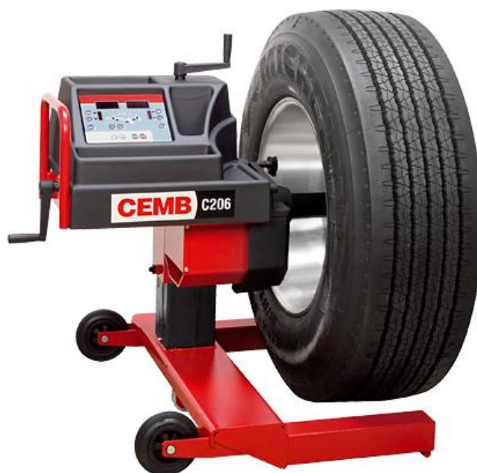
Рисунок 4 - Общий вид стендов C206