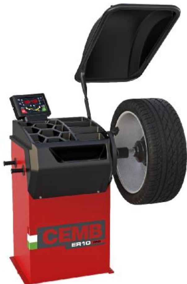
Рисунок 9 - Общий вид станков ER10PRO