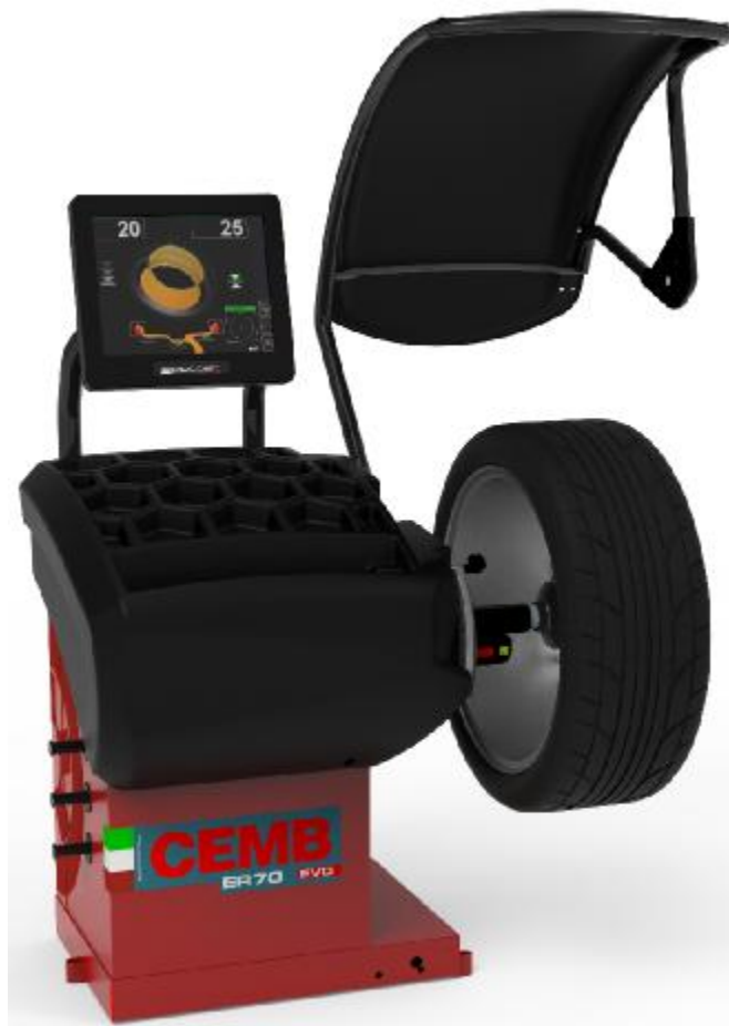
Рисунок 16 - Общий вид станков ER70 EVO