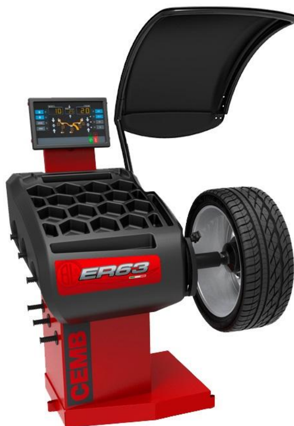
Рисунок 12 - Общий вид станков ER63