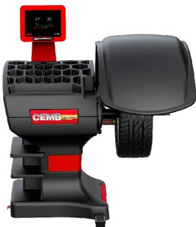
Рисунок 18 - Общий вид станков ER80 Spotter, ER80SE Spotter