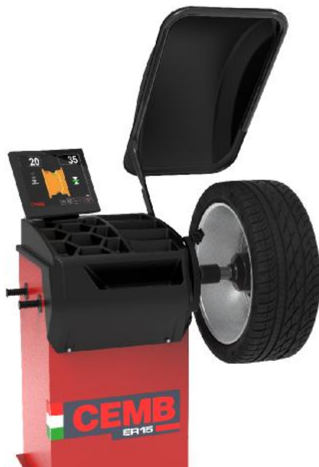
Рисунок 10 - Общий вид станков ER15