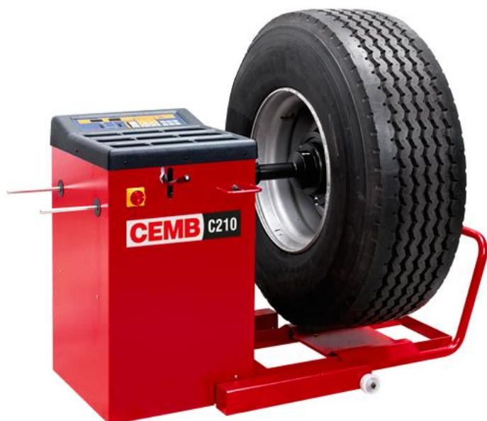
Рисунок 5 - Общий вид станков C210