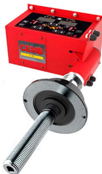
Рисунок 25 - Общий вид станков PAGURO P1