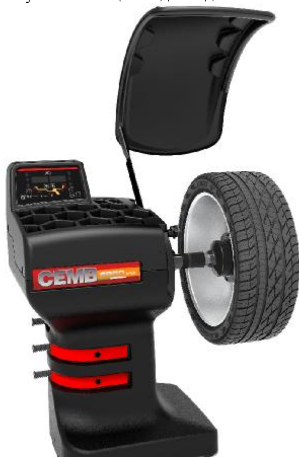
Рисунок 11 - Общий вид станков ER60PRO