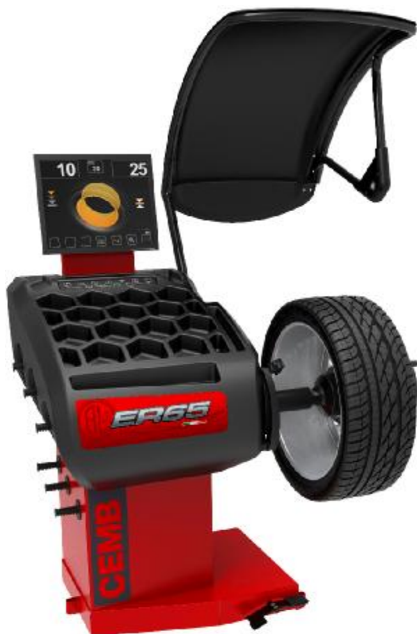
Рисунок 15 - Общий вид станков ER65SE