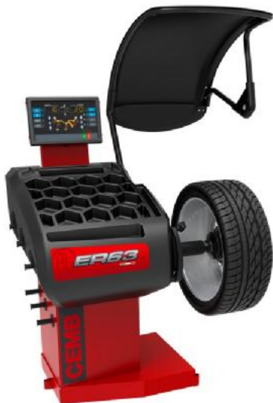
Рисунок 13 - Общий вид станков ER63SE