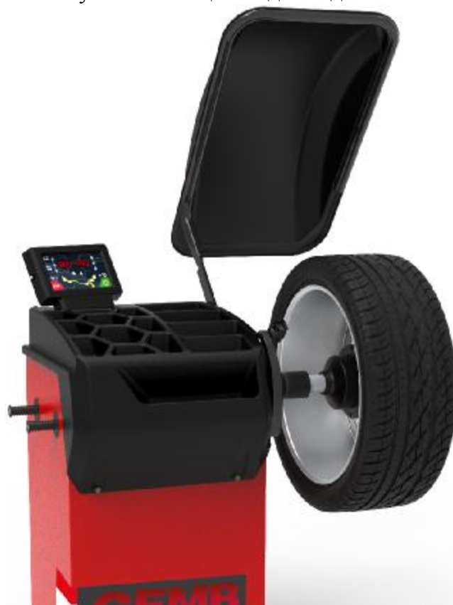
Рисунок 8 - Общий вид станков ER10