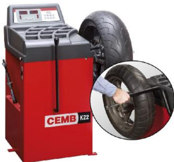
Рисунок 24 - Общий вид станков K22 HS