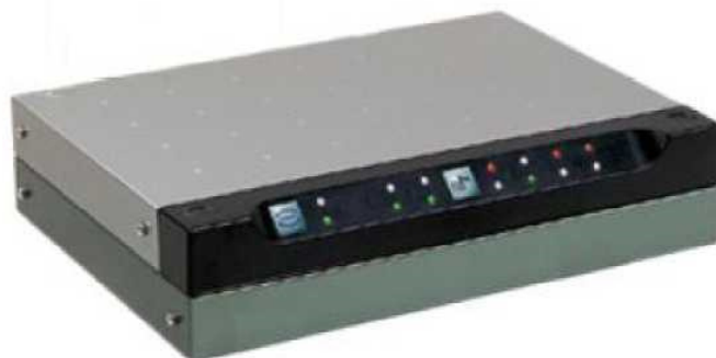
Рисунок 2 –Общий вид устройств интерфейсов связи CIU 880 Prime/Plus

Общий вид устройств интерфейсов связи CIU 880 Prime/Plus представлен на рисунке 2.