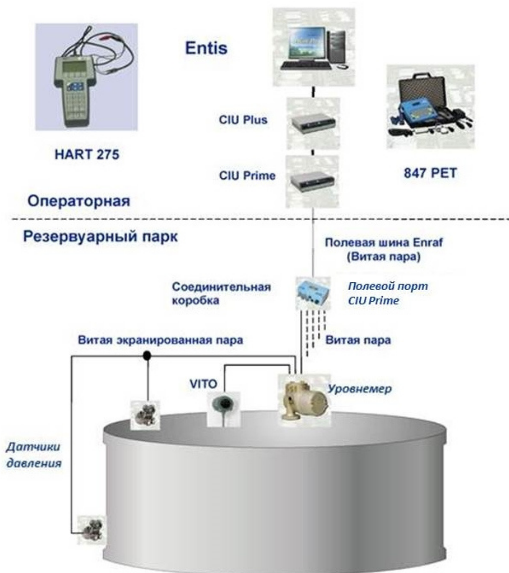
Рисунок 1 – Схема системы коммерческого учета и контроля резервуарных запасов парка товарных нефтепродуктов Entis- т.910-01

Общий вид устройств интерфейсов связи CIU 880 Prime/Plus представлен на рисунке 2.