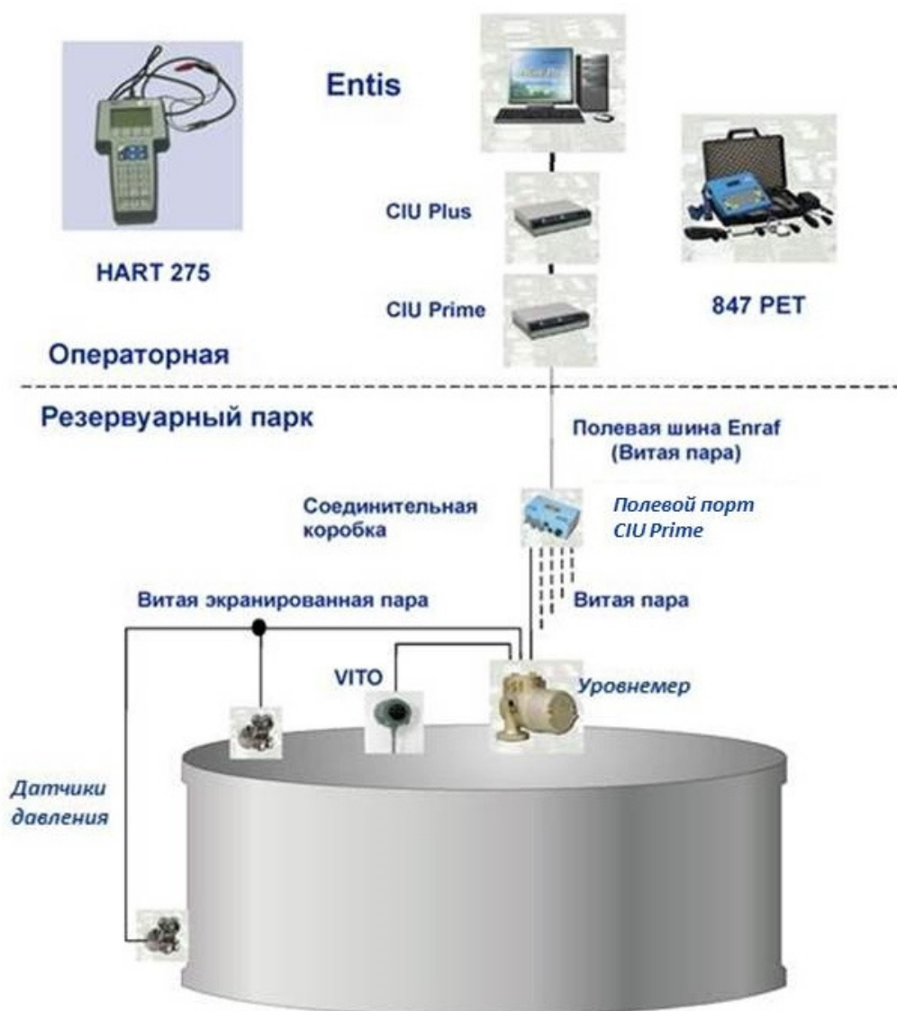
Рисунок 1 – Схема системы коммерческого учета и контроля резервуарных запасов парков товарных нефтепродуктов Entis- т.910-02-04

Общий вид устройств интерфейсов связи CIU 880 Prime/Plus представлен на рисунке 2.