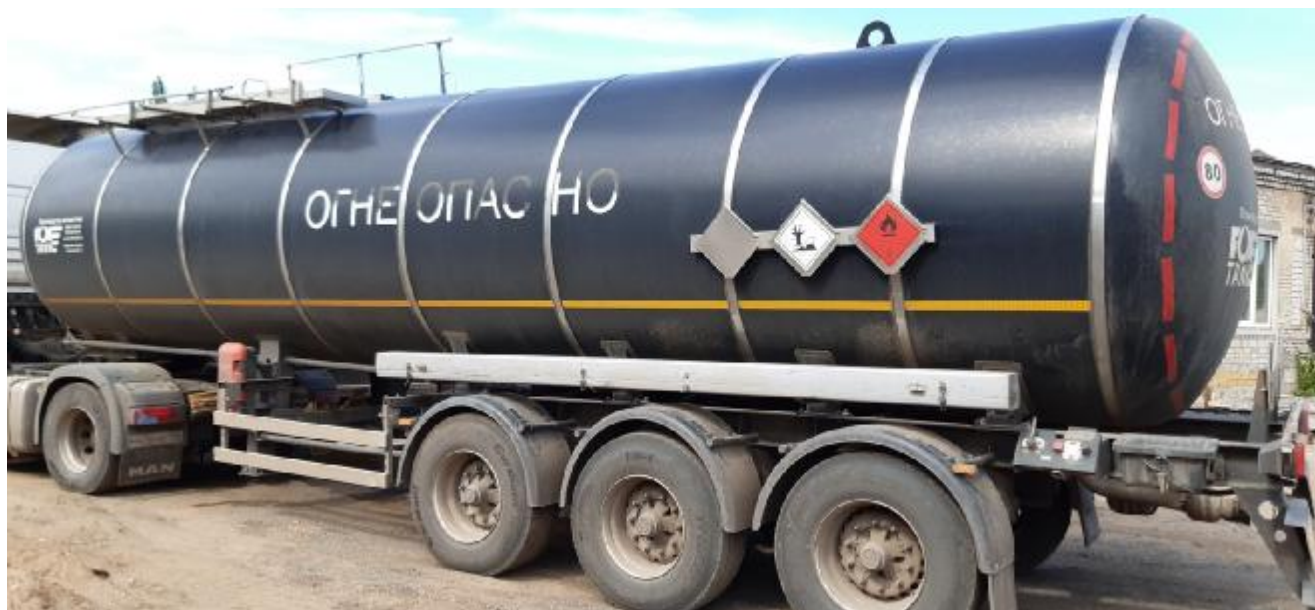
Рисунок 1 - Общий вид полуприцепа-цистерны 966611

Схема пломбировки для защиты от несанкционированного изменения положения указателя уровня налива, обозначение мест нанесения знака поверки представлены на рисунке 2.