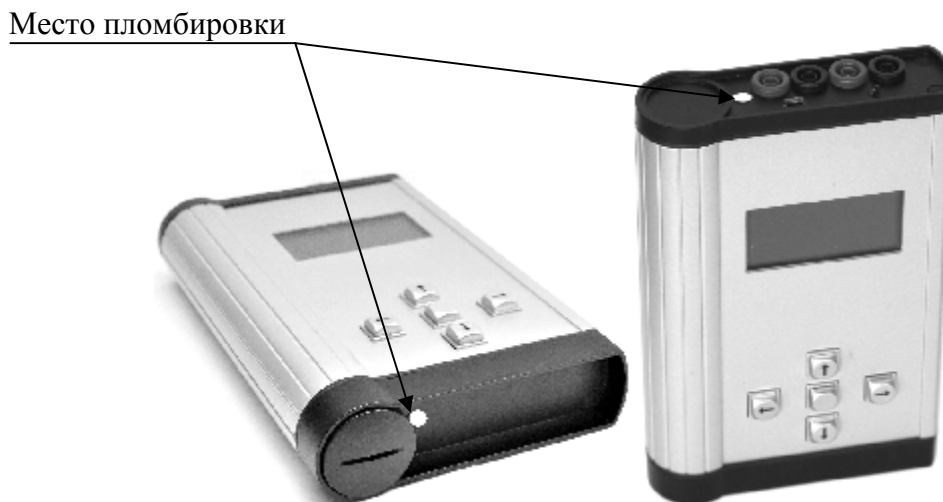
Рисунок 2 – Схема пломбировки от несанкционированного доступа

Схема пломбировки от несанкционированного доступа представлена на рисунке 2.