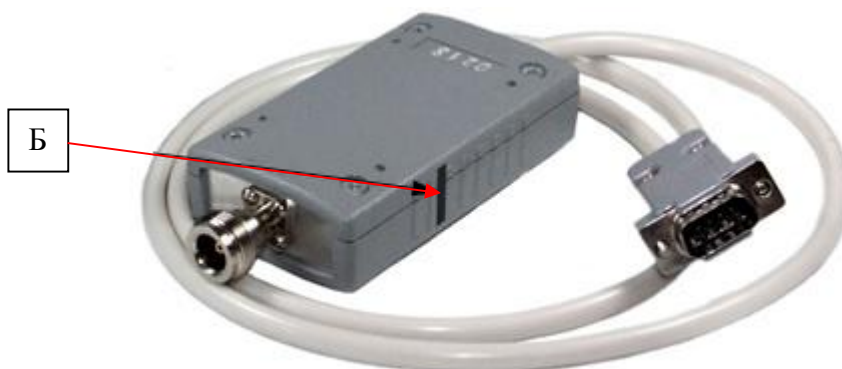
Рисунок 1 – Общий вид вольтметров и место нанесения знака утверждения типа (А)