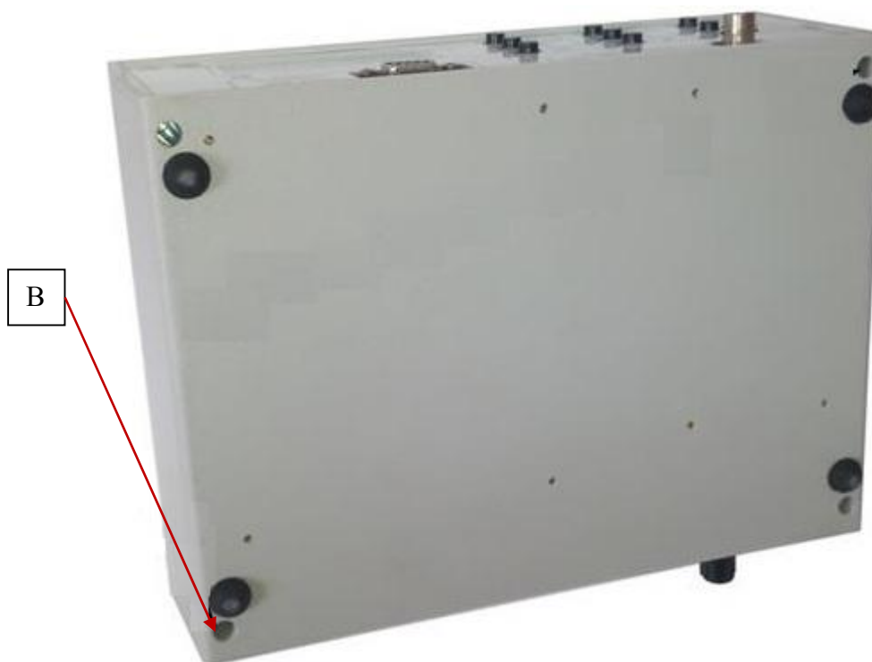
Рисунок 3 – Схема пломбировки от несанкционированного доступа (В)