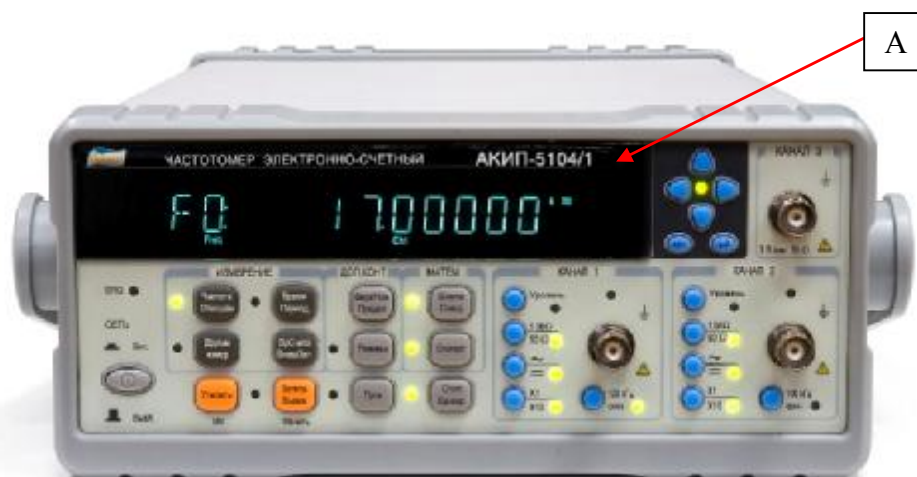
Рисунок 1 – Общий вид частотомеров серий АКИП-5104, АКИП-5108 и место нанесения знака утверждения типа (А)