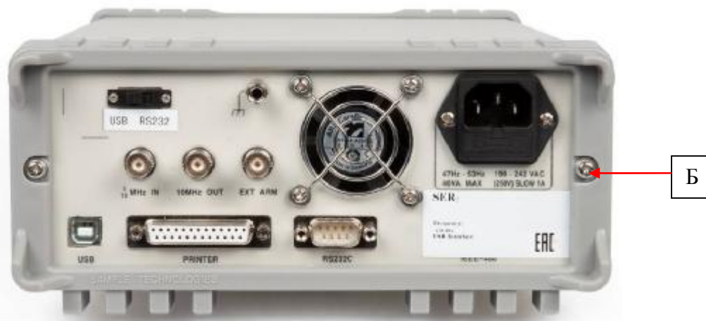
Рисунок 4 – Схема пломбировки от несанкционированного доступа (Б)