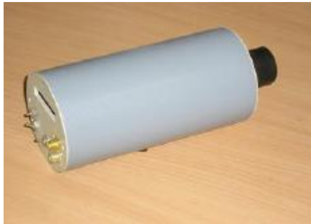
ТЕРМОКОНТ-ТВЗС, ТЕРМОКОНТ-ТВ5С, ТЕРМОКОНТ-ТЦЗС, ТЕРМОКОНТ-ТЦ5С, Рисунок 5 – Общий вид средства измерений

Пломбирование пирометров ТЕРМОКОНТ не предусмотрено.