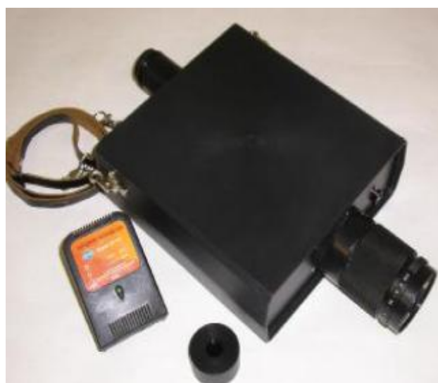
Рисунок 1 - Общий вид средства измерений

ТЕРМОКОНТ-ТВ4П, ТЕРМОКОНТ-ТЦ4П, ТЕРМОКОНТ-ТА2П, ТЕРМОКОНТ-ТВ2П, ТЕРМОКОНТ-ТВ5П, ТЕРМОКОНТ-ТЦ5П ТЕРМОКОНТ-ТА3П, ТЕРМОКОНТ-ТВ3П