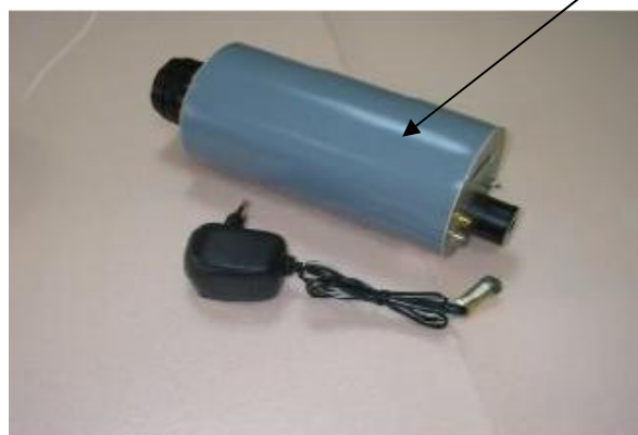
Место нанесения знака утверждения типа