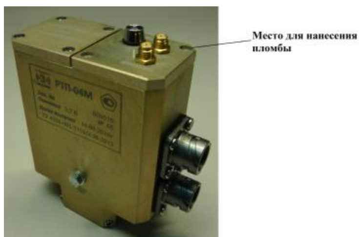
Рисунок 2 - Место нанесения пломбы