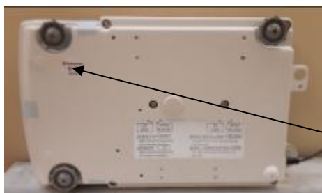
Схема пломбирования контрольными этикетками

Для защиты весов от несанкционированной настройки и вмешательства, которые могут привести к искажению результатов измерений, весы пломбируются контрольными этикетками изготовителя. Схема пломбирования и обозначение места нанесения знака поверки представлены на рисунке 2.