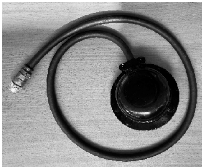
Рисунок 1 – Общий вид датчика