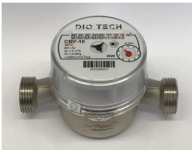
Рисунок 1 – Общий вид счетчиков воды крыльчатых DIO TECH

Общий вид счетчиков представлен на рисунке 1. Схема пломбировки от несанкционированного доступа и обозначения места нанесения знака поверки представлены на рисунке 2.