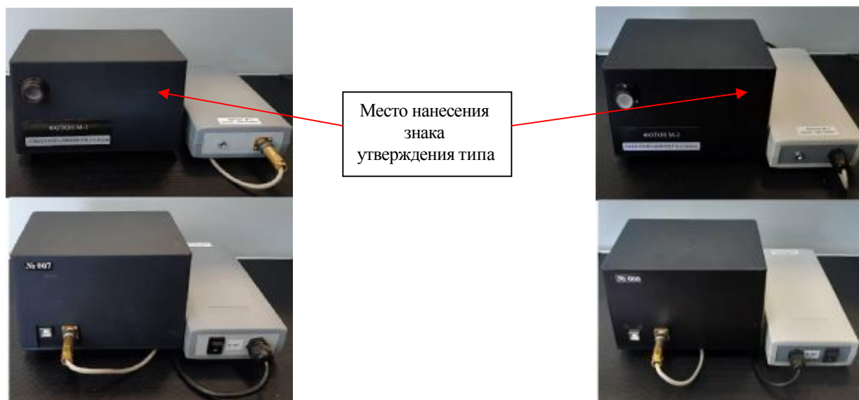
Рисунок 1 - Общий вид спектро радиометров ФОТОН М-1 и ФОТОН М-2 из состава радиометра комбинированного «ФОТОН-М»