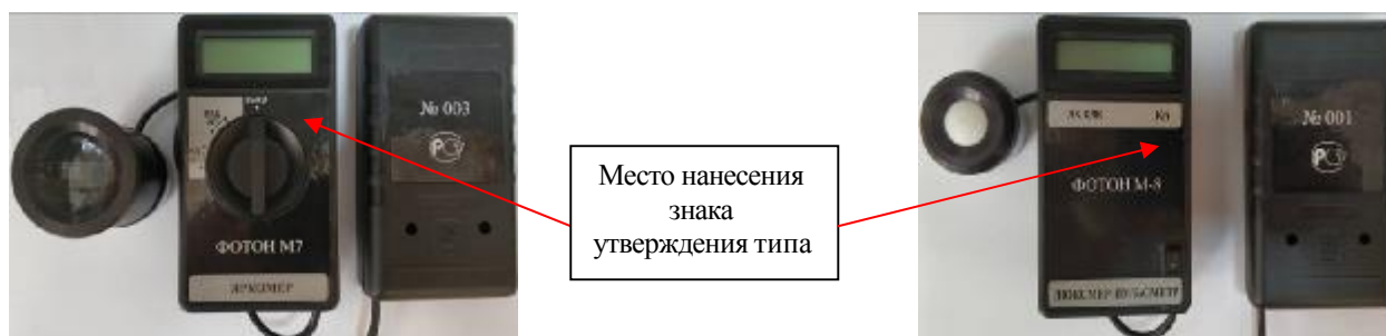
Рисунок 4 - Общий вид яркомера ФОТОН М-7 и люксметра-пульсметра ФОТОН М-8 из состава радиометра комбинированного «ФОТОН-М»

Пломбирование радиометра комбинированного «ФОТОН-М» не предусмотрено.