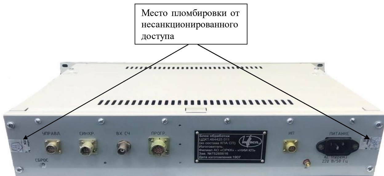
Рисунок 3 – Общий вид задней панели КПА СП