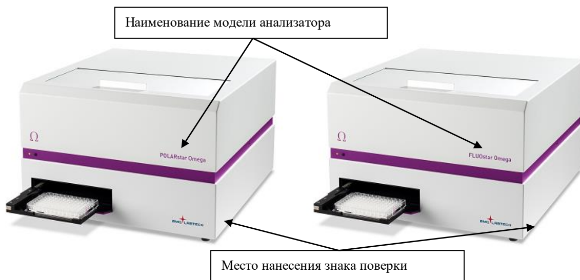
Рисунок 3 - Общий вид анализаторов микропланшетных STAR моделей POLARstar Omega, FLUOstar Omega