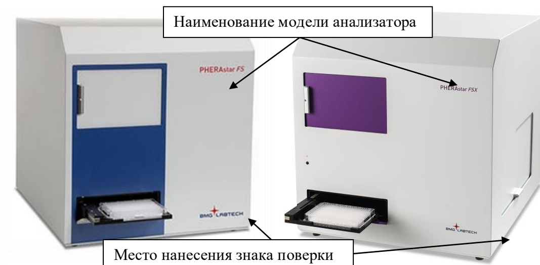
Рисунок 1 - Общий вид анализаторов микропланшетных STAR моделей PHERAstar FS, PHERAstar FSX