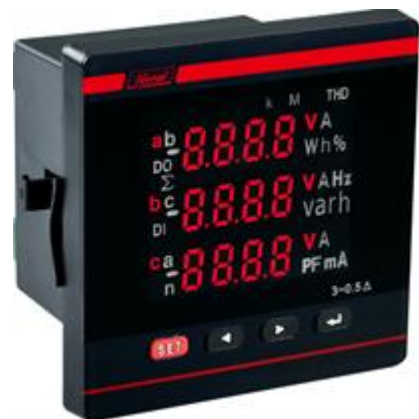
б) модификации MT-XXD-XPН-XX-XX-XX-LCD