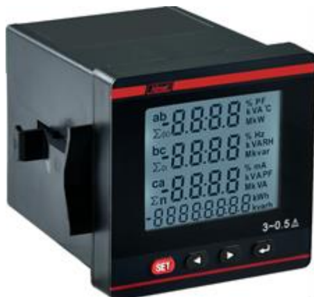
а) модификации MT-XXD-XPН-XX-XX-XX-LED

Общий вид мультиметров представлен на рисунке 2. Пломбирование мультиметров не предусмотрено.