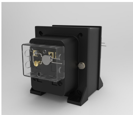
Рисунок 3 – Пломбирование трансформаторов ТТВ007, ТТВ010, ТТВ020, ТТВ050, ТТВ100