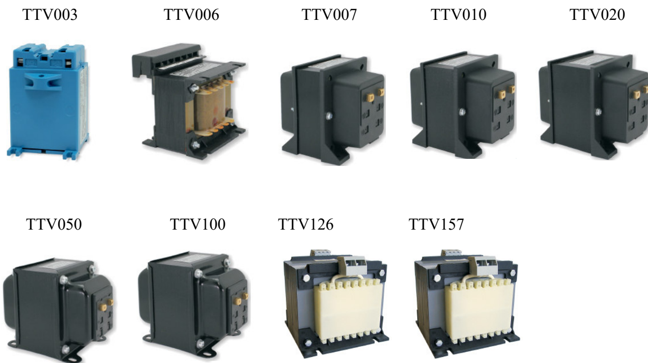
Рисунок 1 - Общий вид трансформаторов

Процесс пломбирования трансформаторов показан на рисунках 2-4.