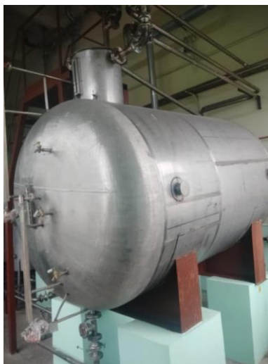
Рисунок 1 - Общий вид мерника М1кл-1000Н, зав.№ 1140