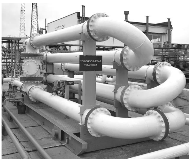
Рисунок 1 – Общий вид ТПУ

Установка пломб на ТПУ осуществляется с помощью контровочной проволоки и свинцовой (пластмассовой) пломбы с нанесением знака поверки давлением на пломбы, установленные: