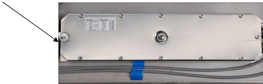
Рисунок 4 – Место пломбирования АЦП ГПУ