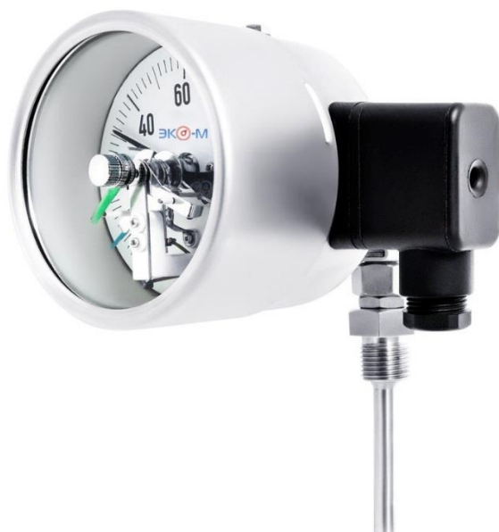
БТ-4 (с электроконтактным устройством)