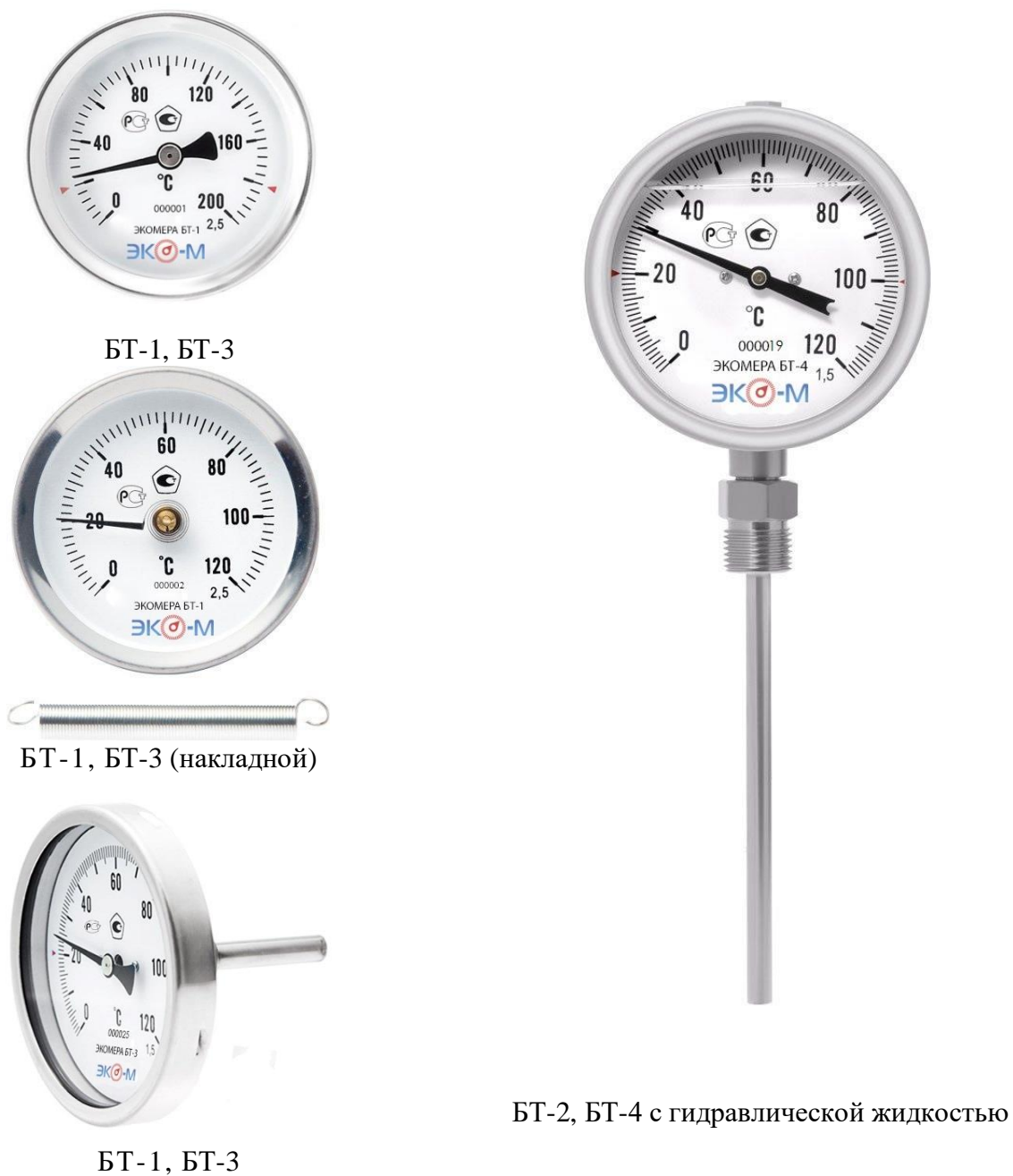
Рисунок 2 – Общий вид термометров биметаллических ЭКОМЕРА БТ