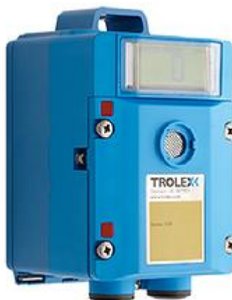
Рисунок 1 – Общий вид детекторов газа беспроводные TX6355 Sentro