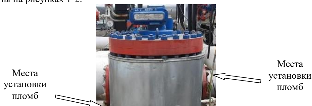
Рисунок 1 – Схема пломбировки от несанкционированного доступа ПР*

Схемы пломбировки от несанкционированного доступа с местами установки пломб представлены на рисунках 1-2.