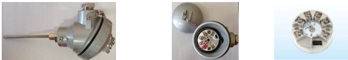
Рисунок 1 – Общий вид ПТИ и его составных частей

Защита от несанкционированного доступа с целью предотвращения несанкционированных настроек и вмешательства, которые могут привести к искажению результатов измерений осуществляется пломбированием с помощью наклейки разъёма