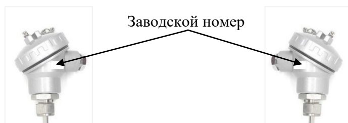
Рисунок 3 – Места расположения заводских номеров

Заводские номера состоят из сочетаний арабских цифр, прописных латинских букв и арабских цифр и (или) прописных латинских букв и арабских цифр, нанесены на этикетки из полихлорвиниловой пленки методом струйной печати, этикетки наклеены на корпус коммутационной головки ПТИ. Места расположения заводских номеров представлены на рисунке 3.