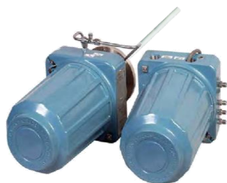
Рисунок 1 – Общий вид газоанализаторов раздельного монтажа без локального интерфейса оператора LOI

Схема пломбировки от несанкционированного доступа, обозначение места нанесения знака поверки представлены на рисунке 6.