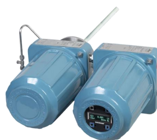
Рисунок 4 – Общий вид газоанализаторов интегрального монтажа с локальным интерфейсом оператора LOI