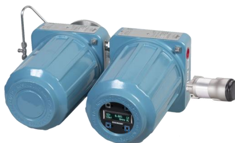
Рисунок 5 – Общий вид газоанализаторов с беспроводным модулем радиосвязи Rosemount 775 (THUM™ - адаптер)