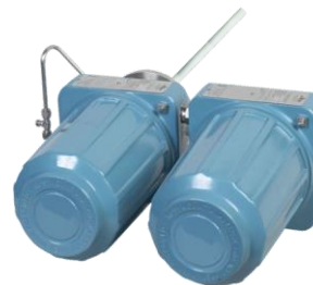
Рисунок 2 – Общий вид газоанализаторов интегрального монтажа без локального интерфейса оператора LOI