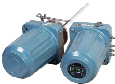
Рисунок 3 – Общий вид газоанализаторов раздельного монтажа с локальным интерфейсом оператора LOI