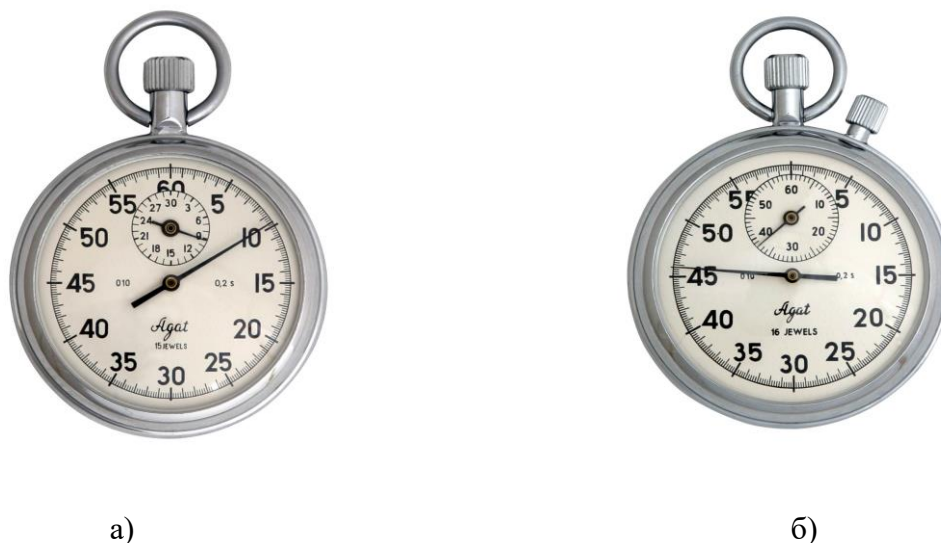
Рисунок 1 – Общий вид секундомеров механических однострелочных СО а) исполнение СОПр; б) исполнение СОСпр