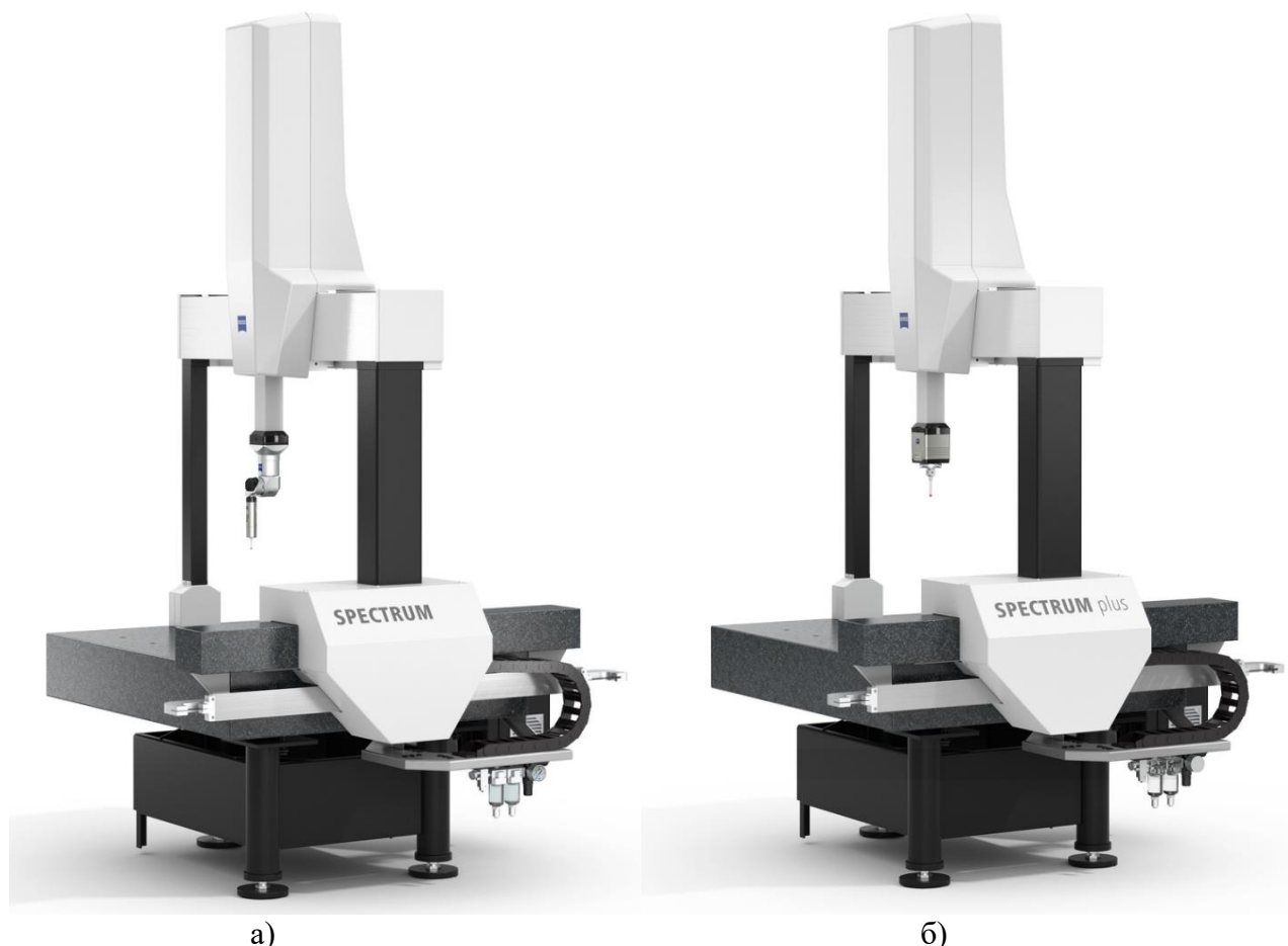
Рисунок 2 - Общий вид машин координатно-измерительных SPECTRUM(а) и SPECTRUM Plus(б).

В процессе эксплуатации, КИМ не предусматривает внешних механических или электронных регулировок. Опломбирование КИМ от несанкционированного доступа и нанесения знака утверждения типа не предусмотрено.