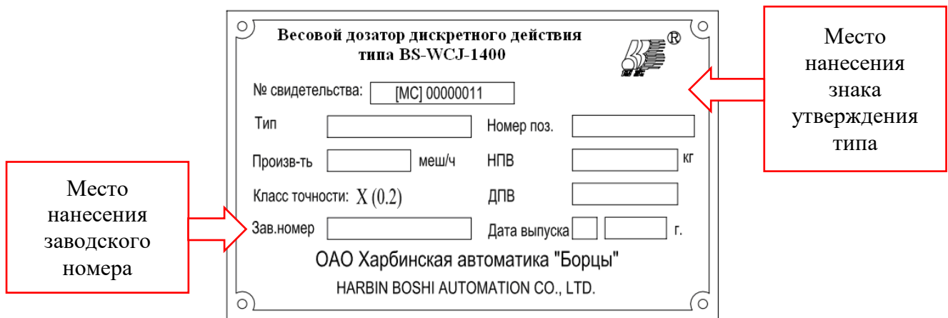
Рисунок 2 – Место нанесения знака утверждения типа и заводского номера