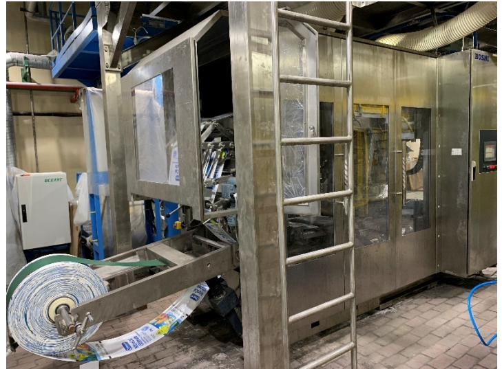
Рисунок 1 – Общий вид дозаторов