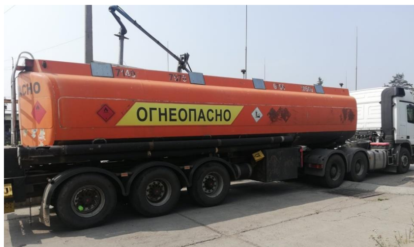
Рисунок 1 – Общий вид полуприцепа-цистерны BNT DROMECH CNK324.