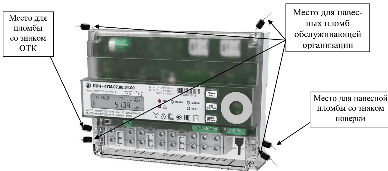
Рисунок 3 – Общий вид счетчика для установки на DIN-рейку, схема пломбировки от несанкционированного доступа, обозначение места нанесения знака поверки

Общий вид счетчиков установки на DIN-рейку (таблица 5), схема пломбировки от несанкционированного доступа, место нанесения знака поверки представлены на рисунке 3.