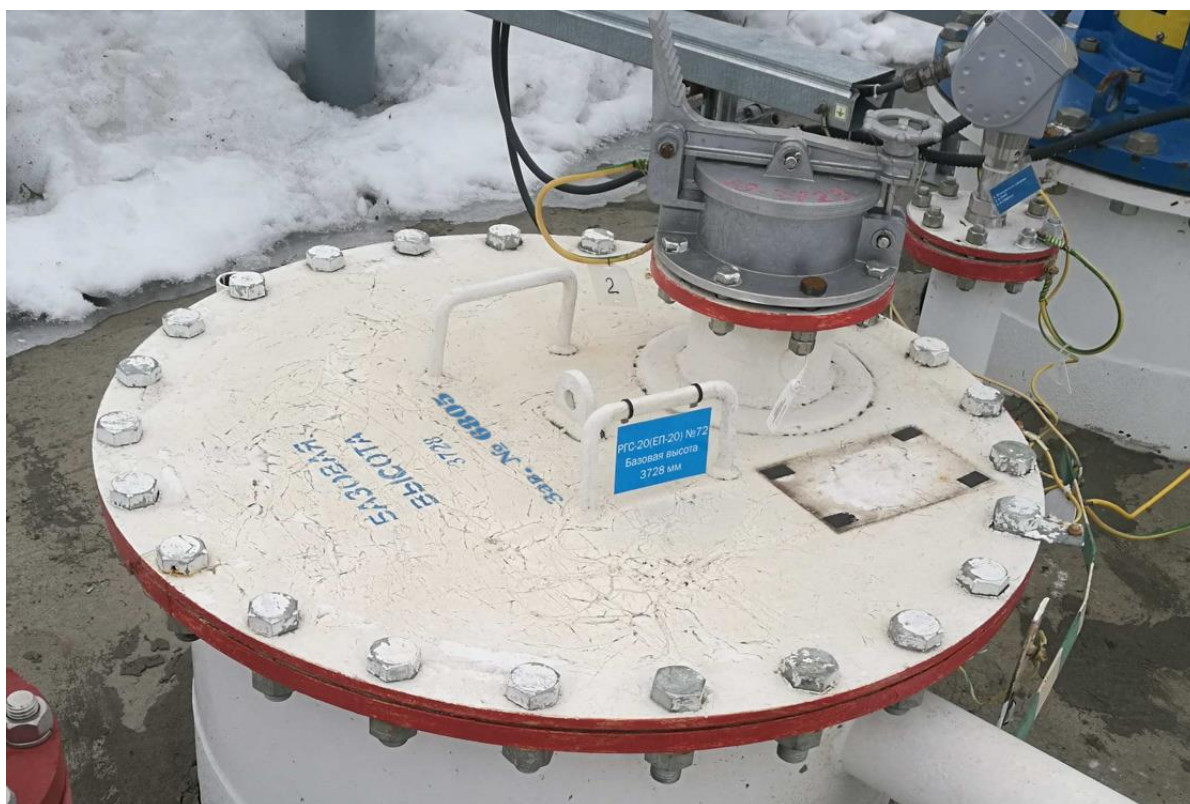
Рисунок 1 – Общий вид резервуара РГС-20 с заводским номером 6805