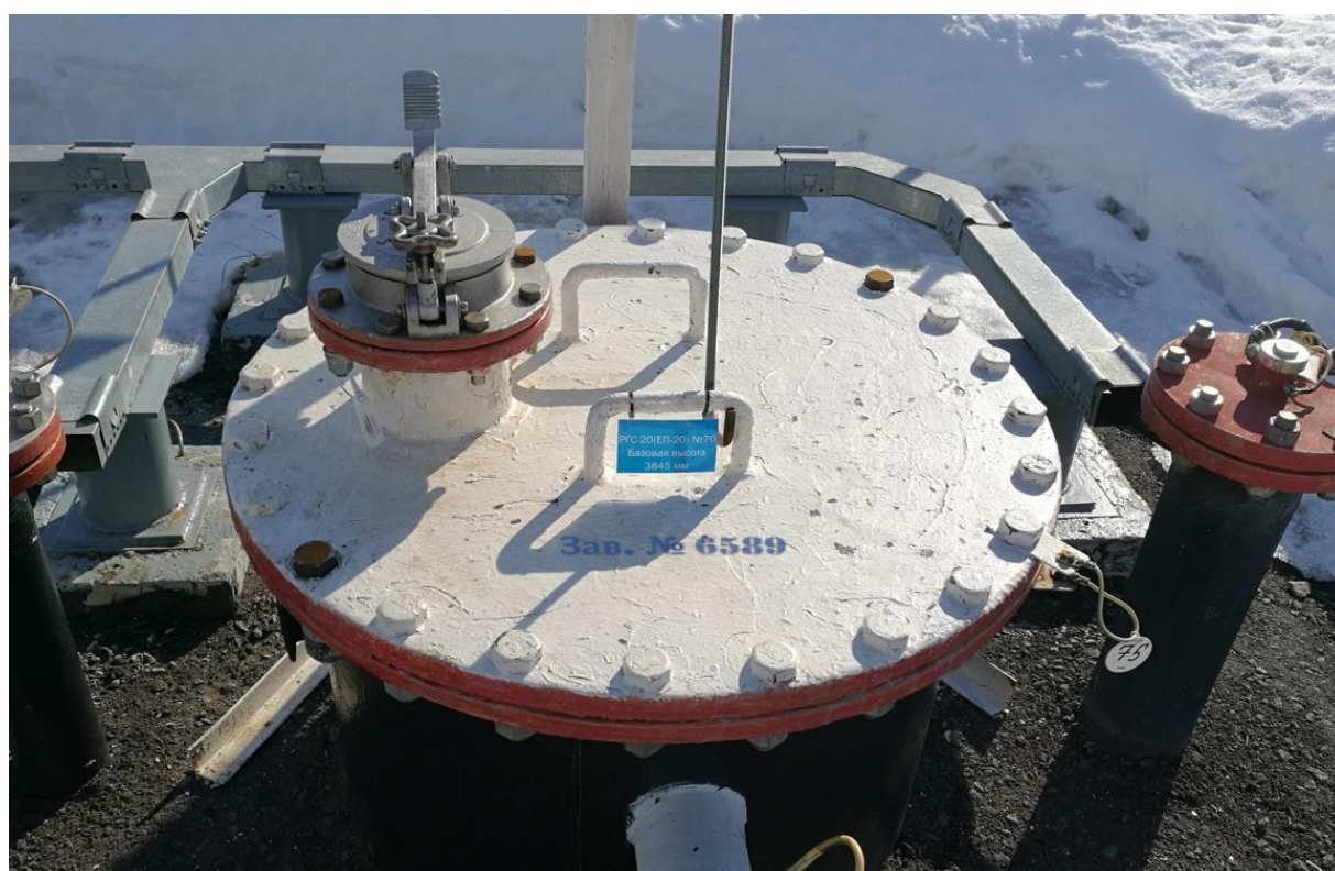
Рисунок 2 – Общий вид резервуара РГС-20 с заводским номером 6589