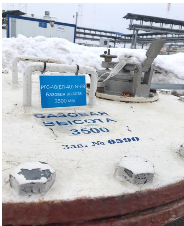
Рисунок 1 – Общий вид резервуара РГС-40