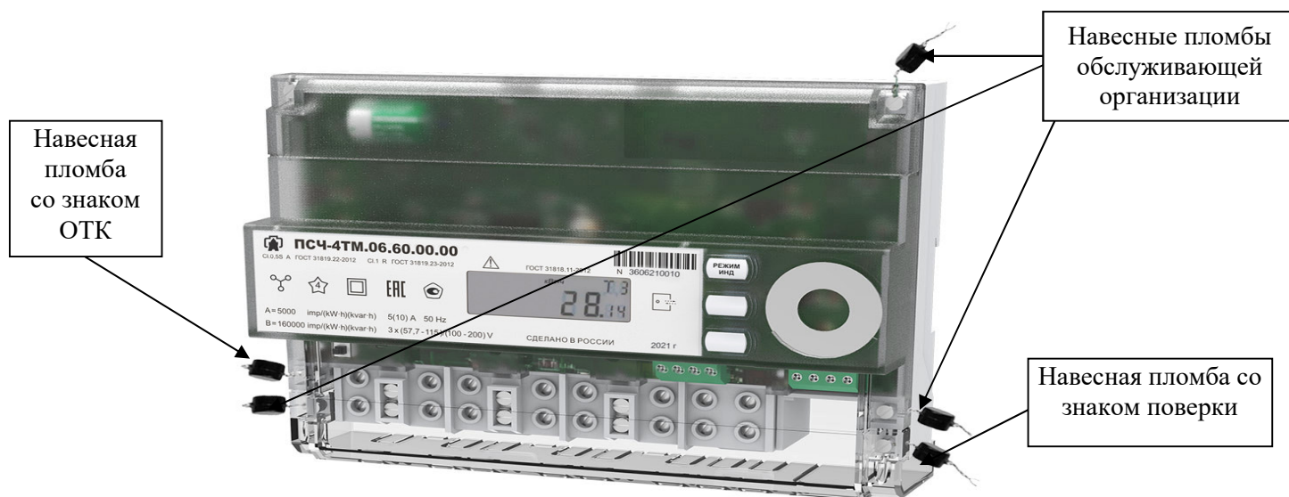
Рисунок 3 – Общий вид счетчика для установки на DIN-рейку, схема пломбировки от несанкционированного доступа, обозначение места нанесения знака поверки