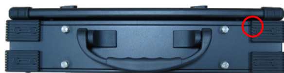
○ – место нанесения защитной этикетки