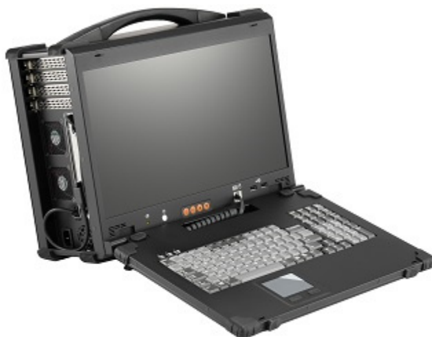
Рисунок 16 – Общий вид Прибора СИГМА-2.РС1