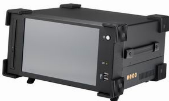
Рисунок 17 – Общий вид Прибора СИГМА-2.РС2