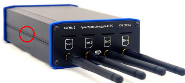
○ – место нанесения защитной этикетки Рисунок 7 – Общий вид транспортного модуля СПРС СИГ.СПРС4.