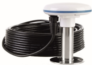
Рисунок 11 – Внешний приемник временной синхронизации