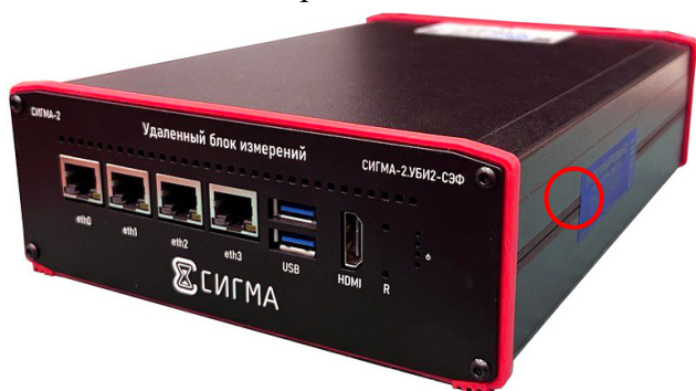
○ – место нанесения защитной этикетки Рисунок 13 – Общий вид Прибора СИГМА-2.УБИ2-СЭФ