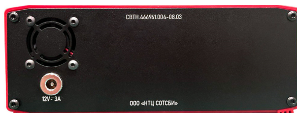
Рисунок 14 – Вид задней панели Прибора СИГМА-2.УБИ2-СЭФ