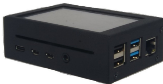
Рисунок 12 – Общий вид Прибора СИГМА-2.УБИ1