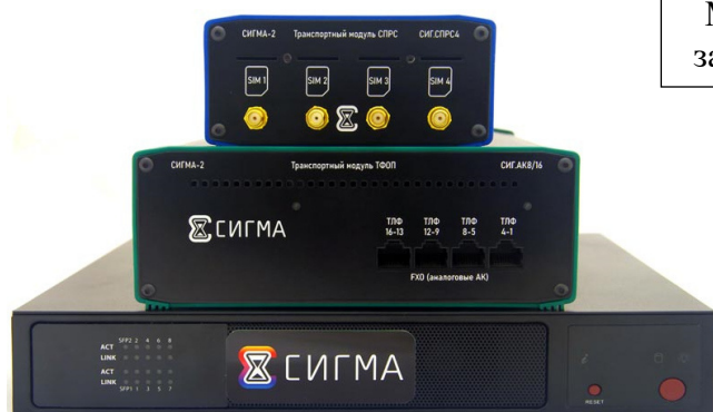
Рисунок 2 – Общий вид Прибора СИГМА-2.МС обычного исполнения с транспортными модулями СИГ.СПРС4, СИГ.АК16

Пломбирование транспортных модулей СИГ.СПРС1, СИГ.СПРС8 не предусмотрено.