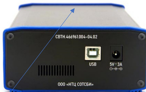
Рисунок 8 – Вид задней панели транспортного модуля СПРС СИГ.СПРС4