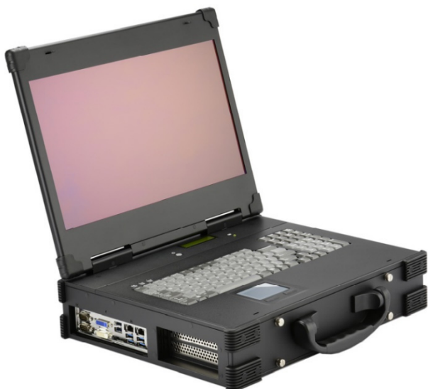
Рисунок 15 – Общий вид Прибора СИГМА-2.МПК2 ПИ