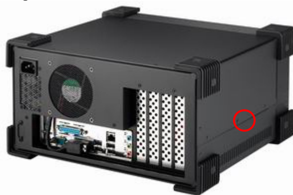
○ – место нанесения защитной этикетки